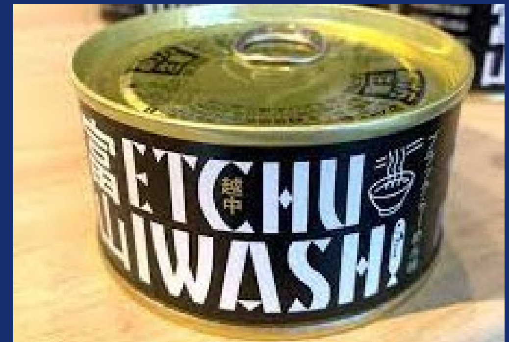
2021年 最優秀賞受賞 富山県立滑川高等学校 イワシのブラックラーメン缶詰