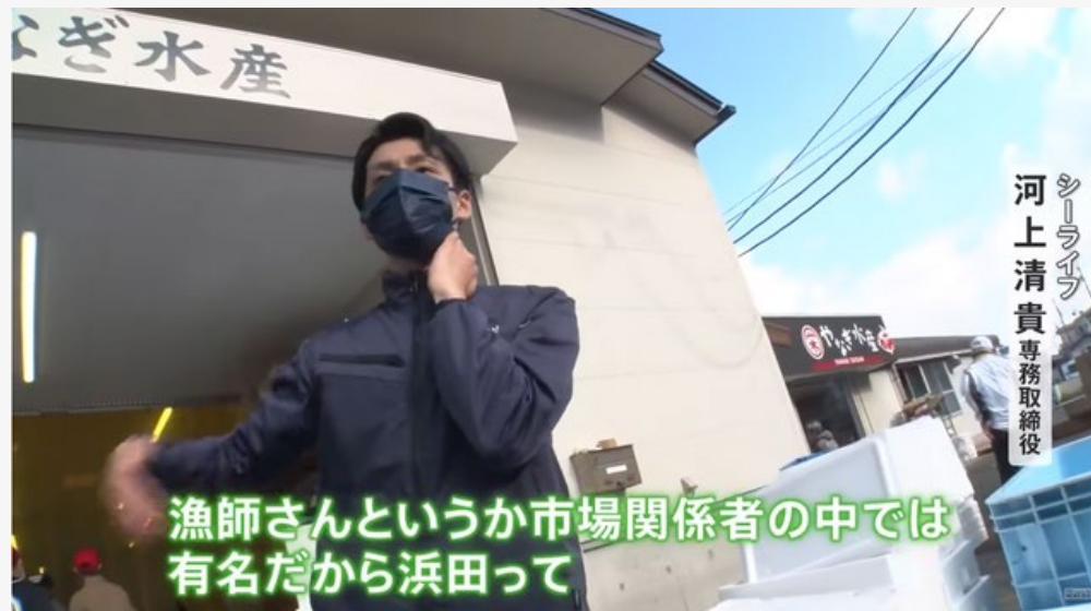
2022年11月 TBS 「Nスタ」