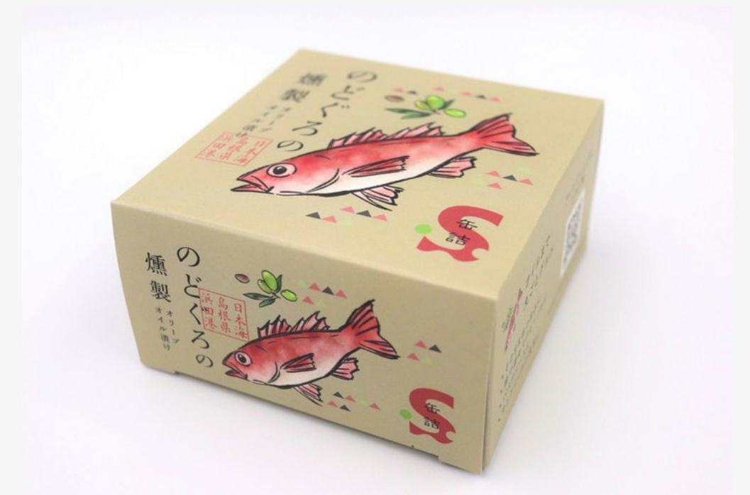
のどぐろ燻製オイル缶