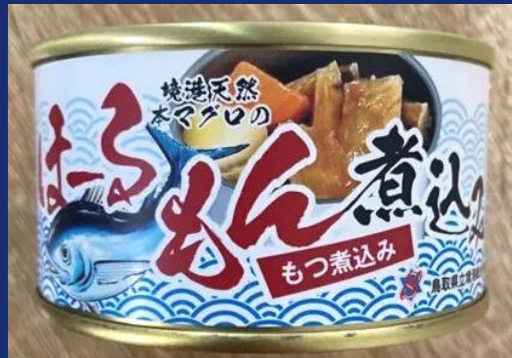
2022年 最優秀賞受賞 鳥取県立境港総合技術高等学校 境港天然本マグロのほーるもん煮込み