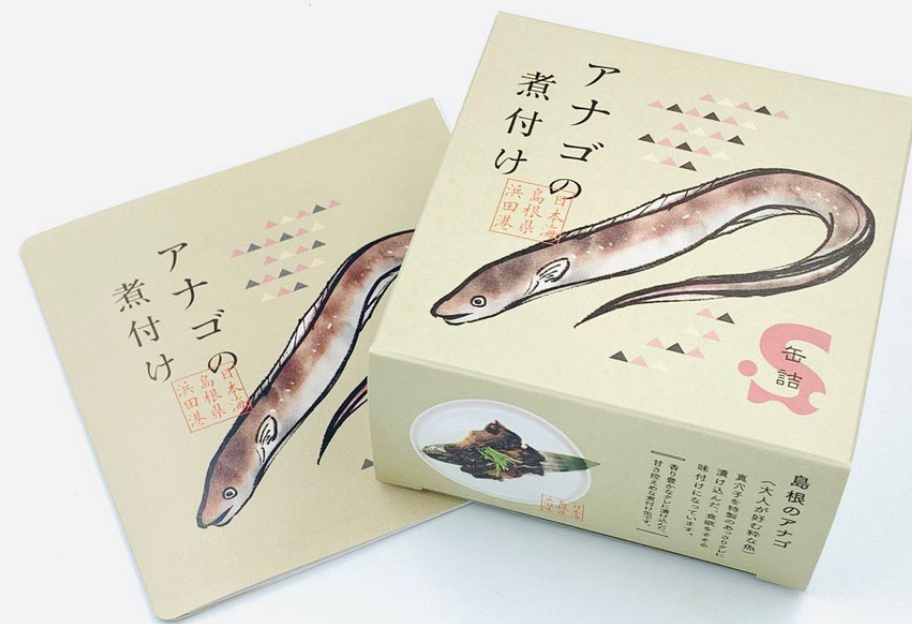
アナゴ煮の付け缶