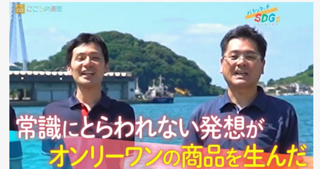
2021年11月 BS朝日 「バトンタッチSDGsはじめてます」