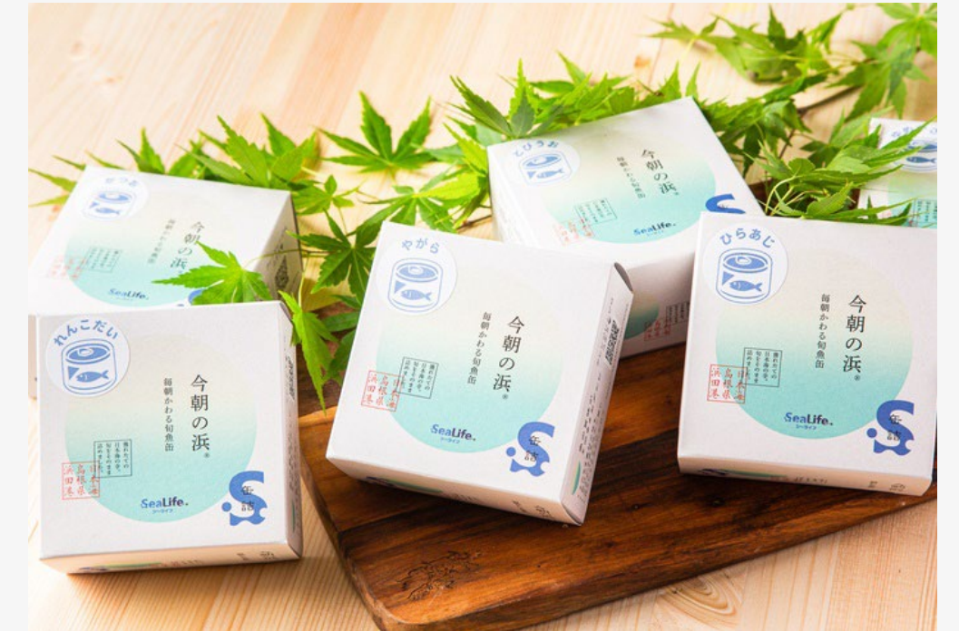
今朝の浜 毎朝かわる旬魚缶