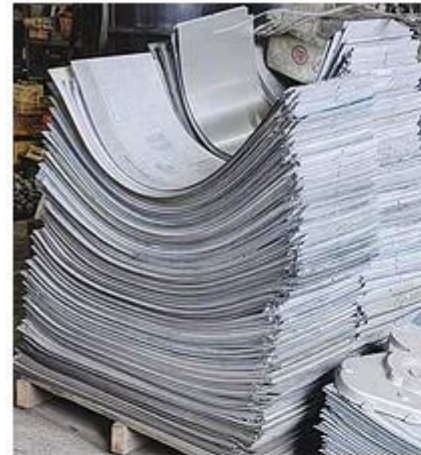
・新聞印刷用の刷版

金森合金はこれからも循環型社会の構築に寄与する製品・サービスを提供するとともに、次世代に向けた環境保全と循環型ものづくりの継承を目指します。