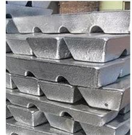
・インゴット（純素材）