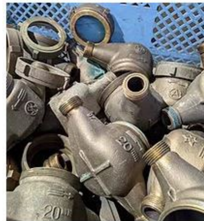
・廃番となった製品