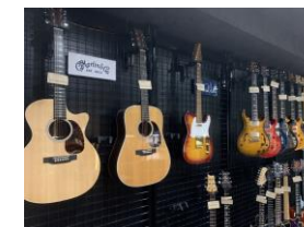
UNISOUND (横浜市南区井土ヶ谷)