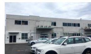
UNISOUND横浜 フルフィルメントセンター