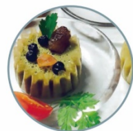
緑黄野菜プリン ドライフルーツトッピング