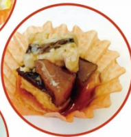
豚と大根の炊き合わせ