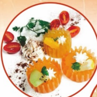
野菜ゼリー&フルーツ